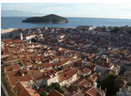
ドゥブロヴニクの旧市街

「よく分からないけど、とりあえず世界遺産だから観光しておこう」なんてもったいないですよ。その歴史的背景や価値を知り、より充実した旅にしてくださいね。