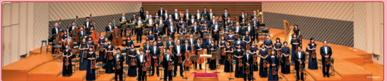
東京交響楽団(オーケストラ)

14:00開演(13:30開場) 大和市文化創造拠点 シリウス 1階 芸術文化ホール メインホール