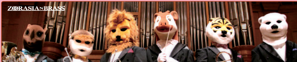
マレーバク(ホルン) ドウクランゲール(トランペット) インドライオン(トランペット) オカビ(指揮) スマトラトラ(トロンボーン) ホッキョクグマ(チューバ) トリのステージマネージャー

高橋宏樹：ストローラマーチ ピゼー：歌劇「カルメン」前奏曲 アンダーソン：ワルツィング・キャット、ホームストレッチ 石川亮太編曲：おんまはみんな、おお！ピクニック [みんなで歌おう！コーナー] 久石譲：「となりのトトロ」より「さんぽ」 ショスタコーヴィチ：祝典序曲