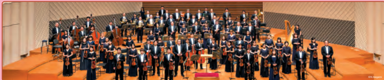
東京交響楽団(オーケストラ)

14:00開演(13:15開場) 大和市文化創造拠点 シリウス 1階 芸術文化ホール メインホール