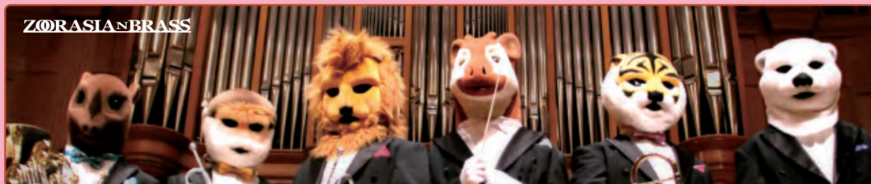
マレーバク(ホルン) ドウ克蘭グール(トランペット) インドライオン(トランペット) オカビ(指揮) スマトラトラ(トロンボーン) ホッキョクグマ(チューバ) トリのステージマネージャー

小笠原寿子:親子のファンタジア アンダーソン:舞踏会の美女 ベートーヴェン:『プロメテウスの創造物』序曲 イエヴァン・ボルッカ(フィンランド民謡/編曲:高橋宏樹) 二組の金管五重奏のためのわらべうた(編曲:高橋宏樹) ベルリオーズ:ローマの謝肉祭