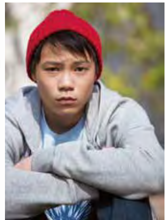
ビリー・レイ 若山 耀人