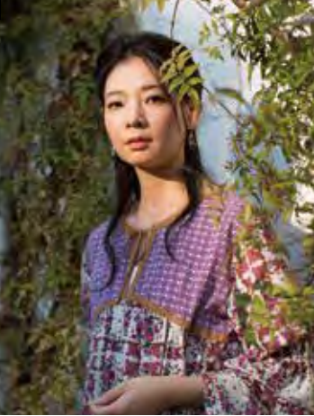
チェルシー・セイアー・ウェイン 朝海 ひかる