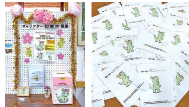
▲ロビーに設置されたキャラクター名の募集箱(左)と募集用紙(右) たくさんのご応募ありがとうございました!

▶「ゆめゴンのへや」は桜丘学習センターで実施している乳幼児と保護者様向けの講座です。親子で楽しめる簡単な工作やリズム遊びなどを行っており、乳幼児をもつ保護者様同士の情報交換の場でもあります。 新キャラクターを迎えるにあたり、3月21日から4月30日まで名前を募集し、80票を超えるたくさんのご応募をいただきました。 今後は「ちえりるんのへや」と事業名称を替え、皆さまに愛されるキャラクターになれるよう頑張ります!