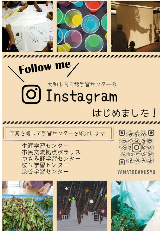
若手プロジェクトチームのポスター

若手プロジェクトチームとは、学習センターの若手職員が集まるグループです。若者ならではの目線から新しい方法で学習センターの魅力を発信していき、より身近に