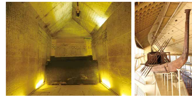
ウナス王のピラミッド内部(左)/太陽の船(右)