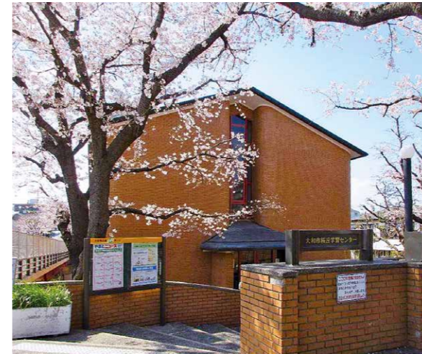
桜丘学習センター外観

桜丘学習センターは小田急江ノ島線桜ヶ丘駅西口から徒歩3分の場所にあり、桜の咲く季節には、美しい桜並木が駅前から学習センターに着くまで続きます。天気の良い日は、窓を開けて春の陽気を感じながら、満開の桜を愛でつつ活動することができますよ。当館では、市民の皆様が生涯学習活動にご利用できるさまざまな部屋をご用意している