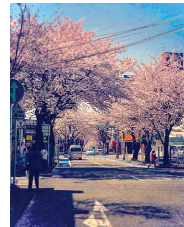
春/桜ヶ丘駅から桜丘学習センターへの道

ほか、団体利用のない部屋は学習室として開放しています。ロビーでは季節ごとの展示を行っており、来館された方が気軽に参加できる展示イベントも開催しています。ぜひご来館ください。▶