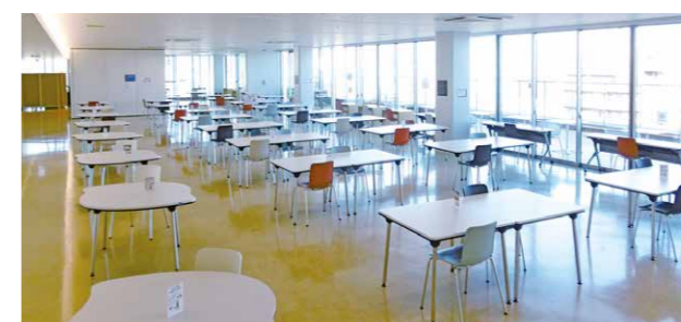
▲会議室(左上) スタジオ(右上) ぷらっと大和(下)