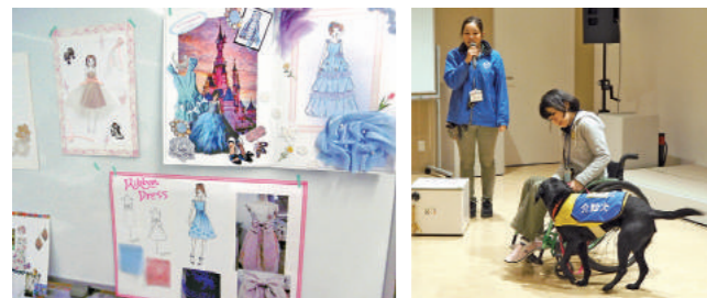
ファッションデザイナー

ラジオパーソナリティとバリスタ講座では、同じ施設(シリウス)内のFMやまと、スターバックスコーヒーYAMATO文化森店にご協力いただきました。参加した子どもたち