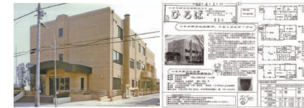
開館当時の様子。左は完成した建物。右は学習センターだより『ひろば』。