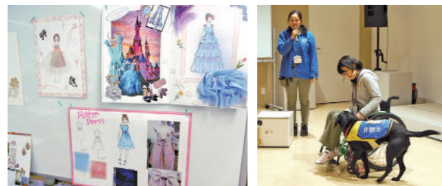
ファッションデザイナー

ラジオパーソナリティとバリスタ講座では、同じ施設(シリウス)内のFMやまと、スターバックスコーヒーYAMATO文化森店にご協力いただきました。参加した子どもたち