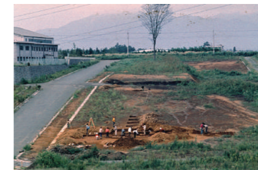
月見野第II遺跡の発掘調査風景。左上は県立大和高校。遠景は丹沢山系。

昭和62年開館当時に開館記念講演会「日本史の謎と発見『遺跡のある町』」を開催しました。この講演会で取り上げた月見野遺跡は一般的にはあまり知られていませんが、旧石器時代研究における有名な遺跡です。発掘された石器や土器から、その時代の人々の生活などを垣間見ることができます。開館から35年後の今年、「地元探究～月見野遺跡を知る」を開催します。地元の歴史に触れて後世へ伝えていきませんか。