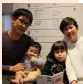
きのしたさん御一家

「シリウスに来るのは2回目です。3階のこども図書館で、上の子が読む本を借りたりしています。同じフロアのこども広場も気になりますが、子どもたちがもう少し大きくなってからかなと思っています。子どもが絵本を見ている間、大人が読める本や雑誌を近くに置いてくれたらうれしいです。」